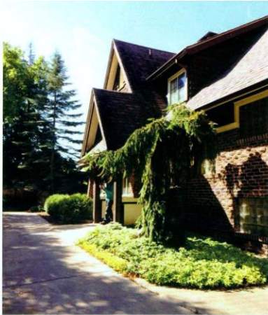
嘉宝之家的两栋房子毗邻而建，中间有一道围墙