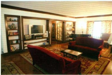
客厅内部体现出 20 世纪风貌